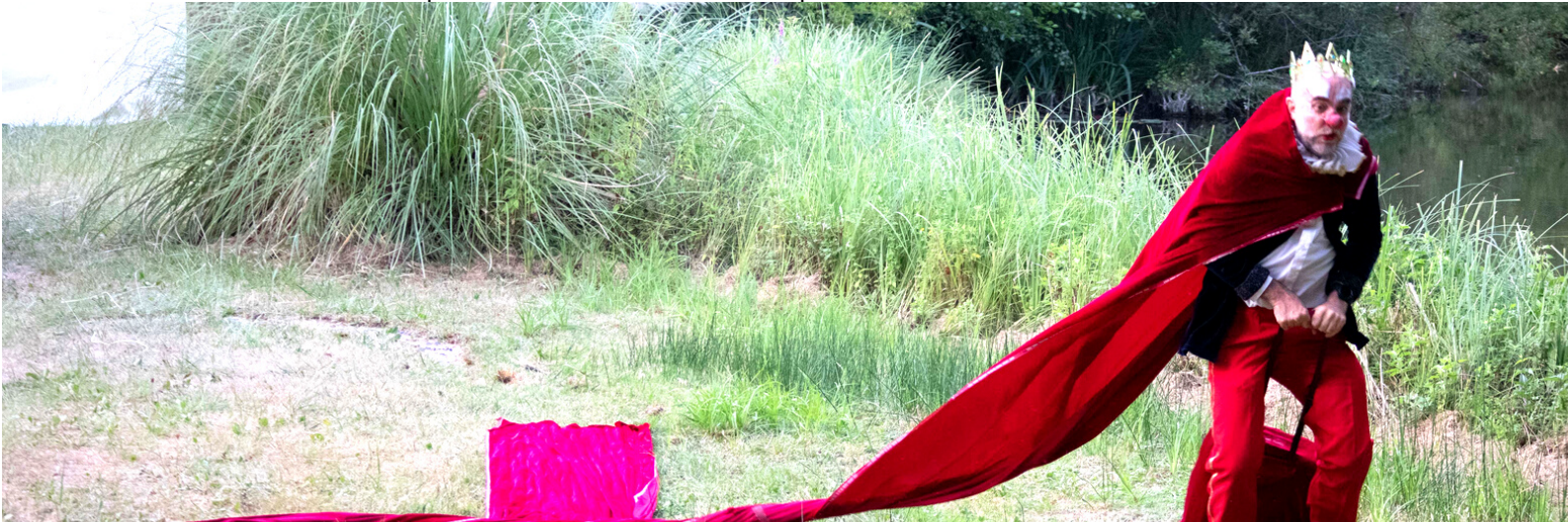
SPECTACLE "L'INCROYABLE AVENTURE DU ROI EMIR, ESPACE DES POSSIBLES JUILLET 2022

Petit à petit, il va s'interroger sur son rapport au pouvoir, sa relation avec le public, et le sens d'être roi et régner. Comment accepter la relation au pouvoir, ne pas le subir, ni s'y opposer, mais l'accueillir avec bienveillance sans en avoir peur ? La question se pose : Comment transformer notre relation au pouvoir en puissance au service de l'équité et de la rencontre ?